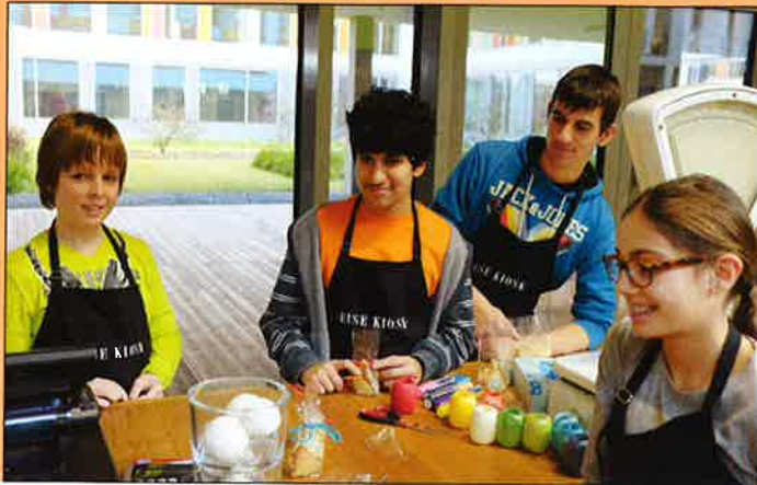
Unten rechts: Das hauseigene Café „Gëlle Fra“ ist sowohl Ausbildungsort als auch eine beliebte Begegnungsstätte im „Ermesinde Lycée“.