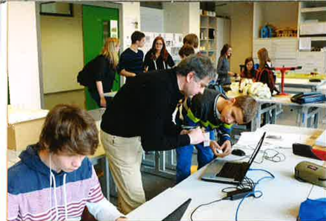
Die Schüler haben ein vielfältiges Ausbildungsangebot in den „Unternehmen“ des „Lycée Ermesinde“: Architekturwerkstatt, Musikstudio, Holzatelier, und Zirkusschule.