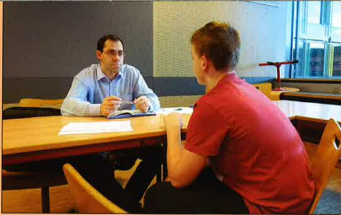
Oben: Ein Schüler bespricht den Aufbau seiner persönlichen Arbeit ( travail personnel ) mit seinem Tutor.