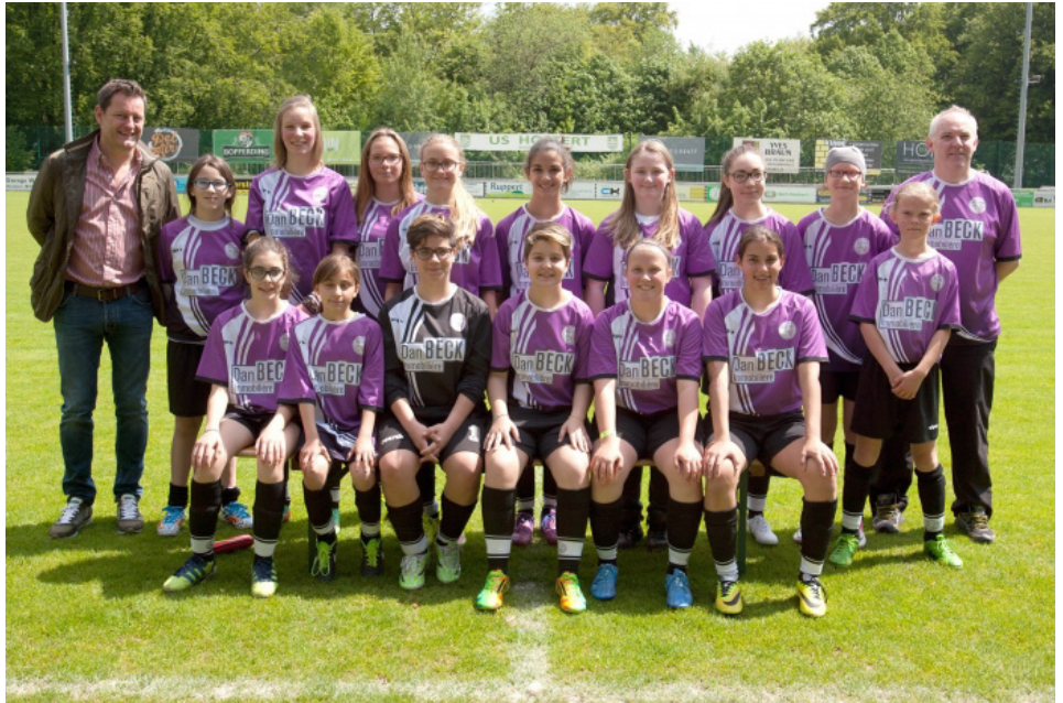
FC Munsbach Entente: Meine alte Fußballmannschaft